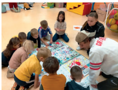
Séance de modelage des parties du corps pour les plus jeunes.

Juste avant les vacances, des étudiants de l'IRSS sont venus faire une séance d'« EPS et sciences » à tous les élèves de l'école. De la maternelle au CM2, les enfants ont ainsi pu faire le lien entre activité physique et fonctionnement du corps.