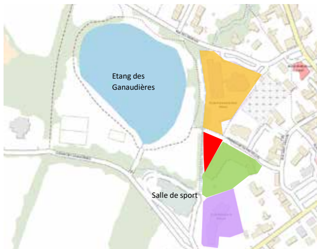
Plan de situation du projet :