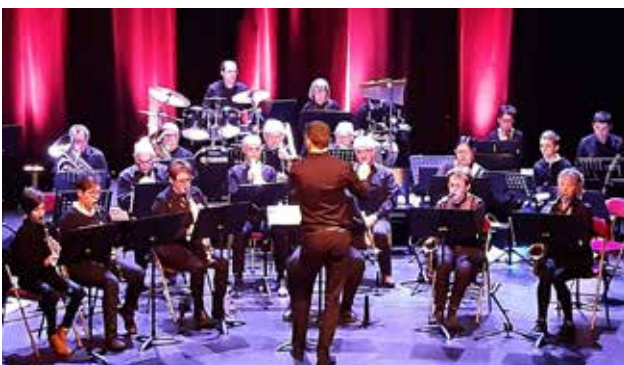
Concert au théâtre Philippe Noiret à Doué en Anjou le 6 mars dernier.

A très bientôt pour de nouvelles aventures musicales !!!